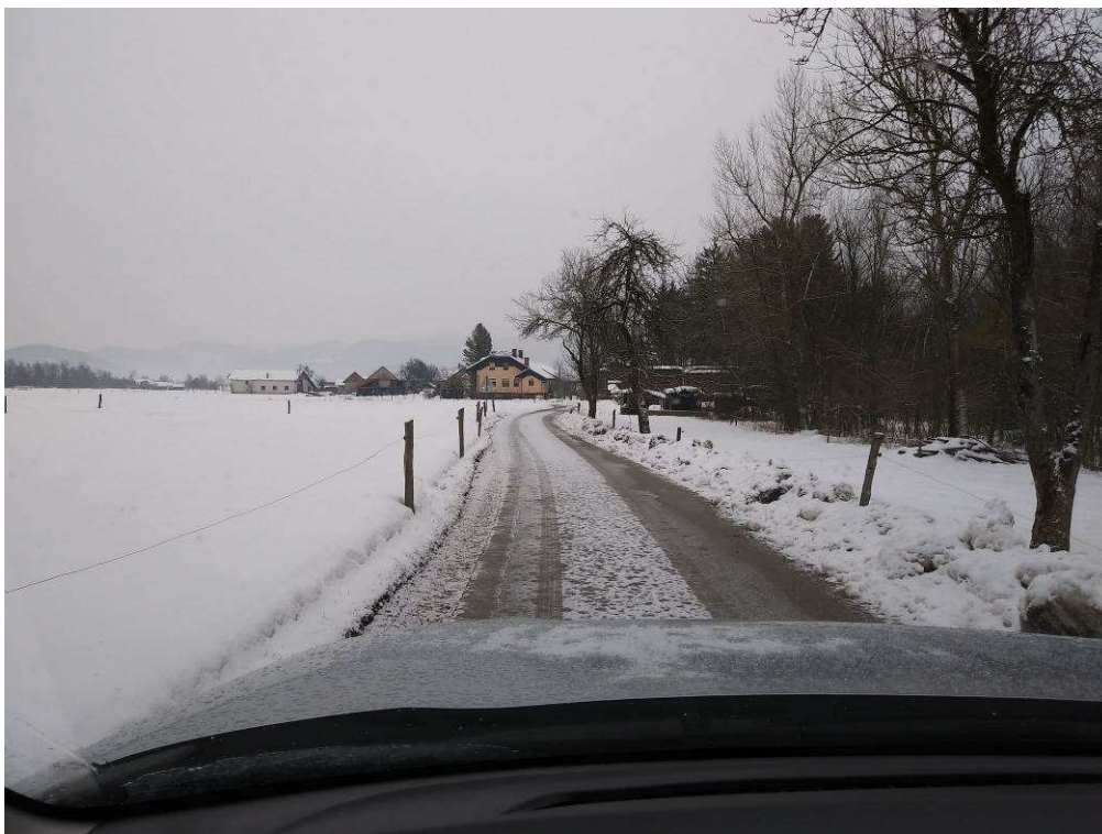
Slika 3: Pogled na traso