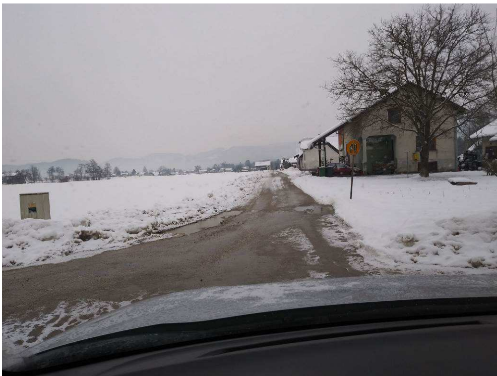
Slika 7: Konec trase