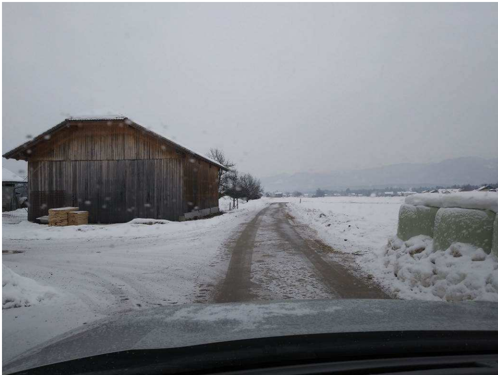
Slika 4: Pogled na traso