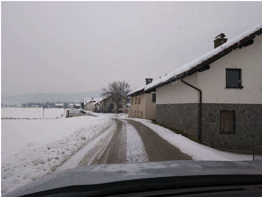
Slika 6: Pogled na traso