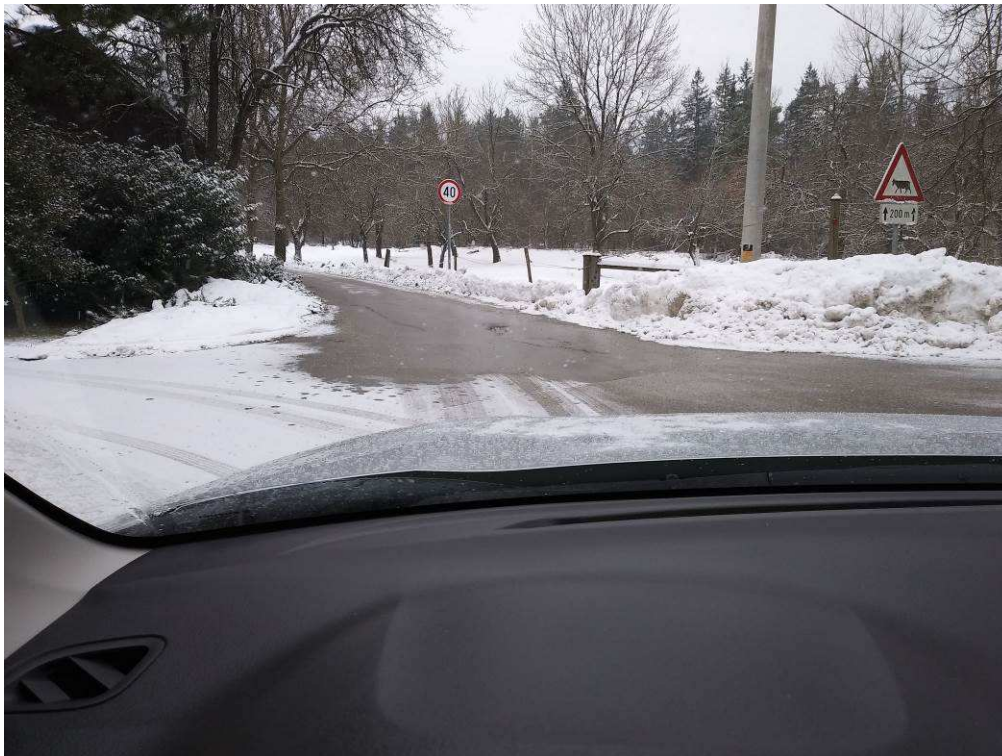
Slika 2: Začetek trase