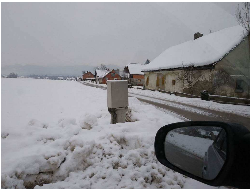
Slika 5: Pogled na traso