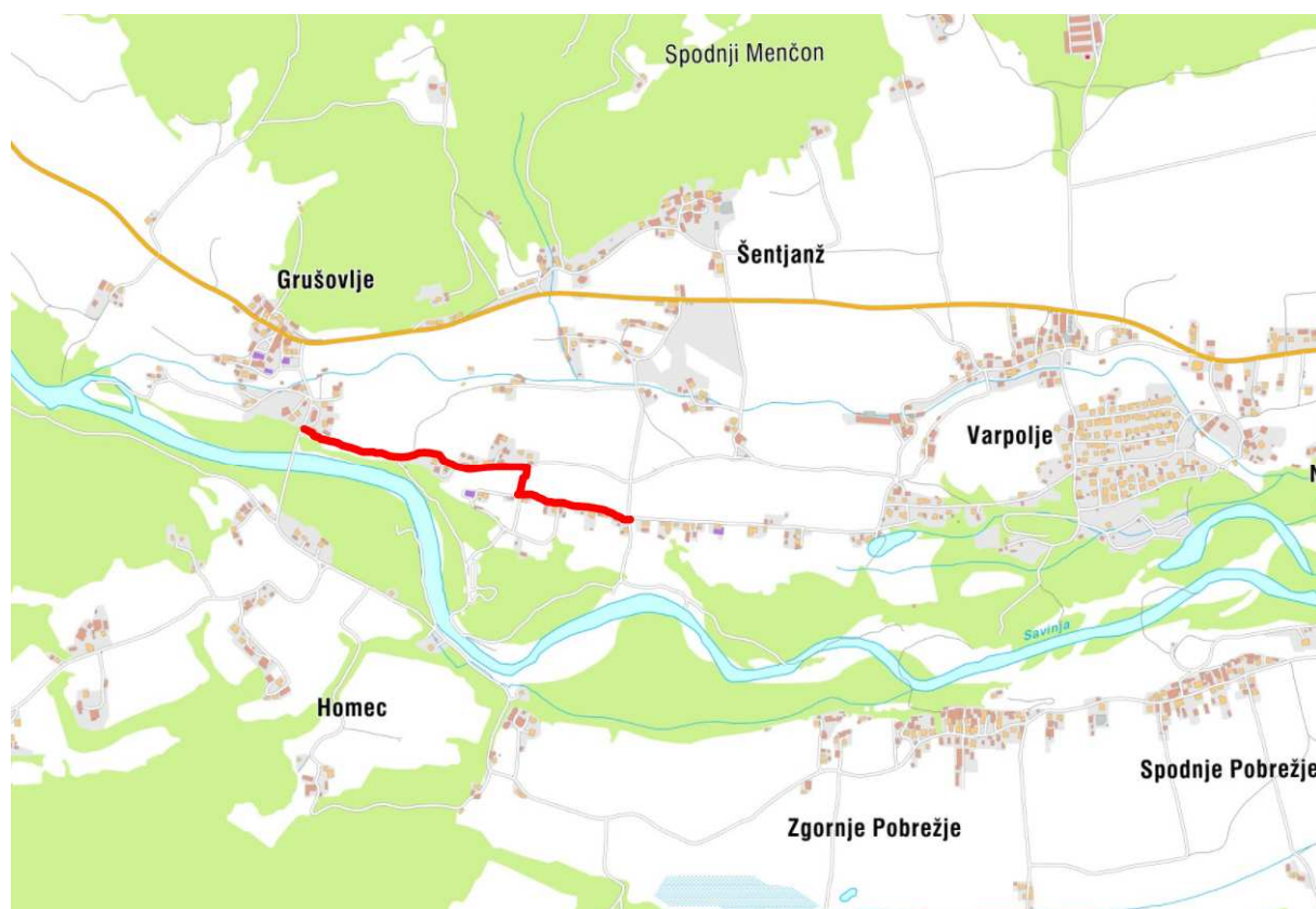
Slika 1: Lokacija odseka

Na osnovi naročila občine Rečica ob Savinji smo izdelali tehnično dokumentacijo za javni razpis rekonstrukcije lokalne ceste LC 267-133 v skupni dolžini 977,00 m.